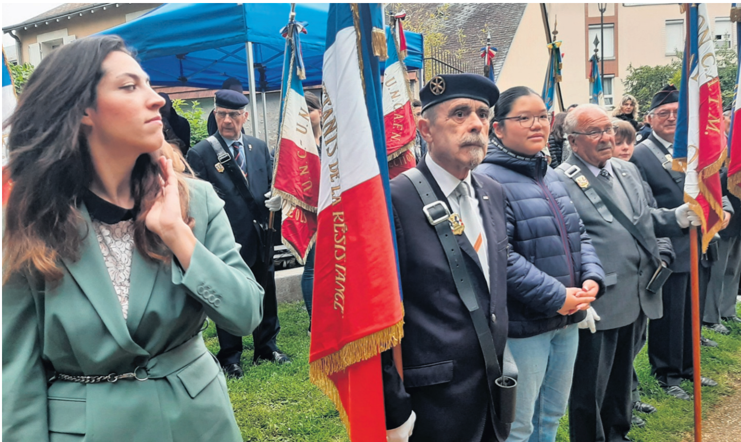
Enfants et adolescents ont été nombreux à participer aux cérémonies ce lundi 8 mai dans l'Indre.