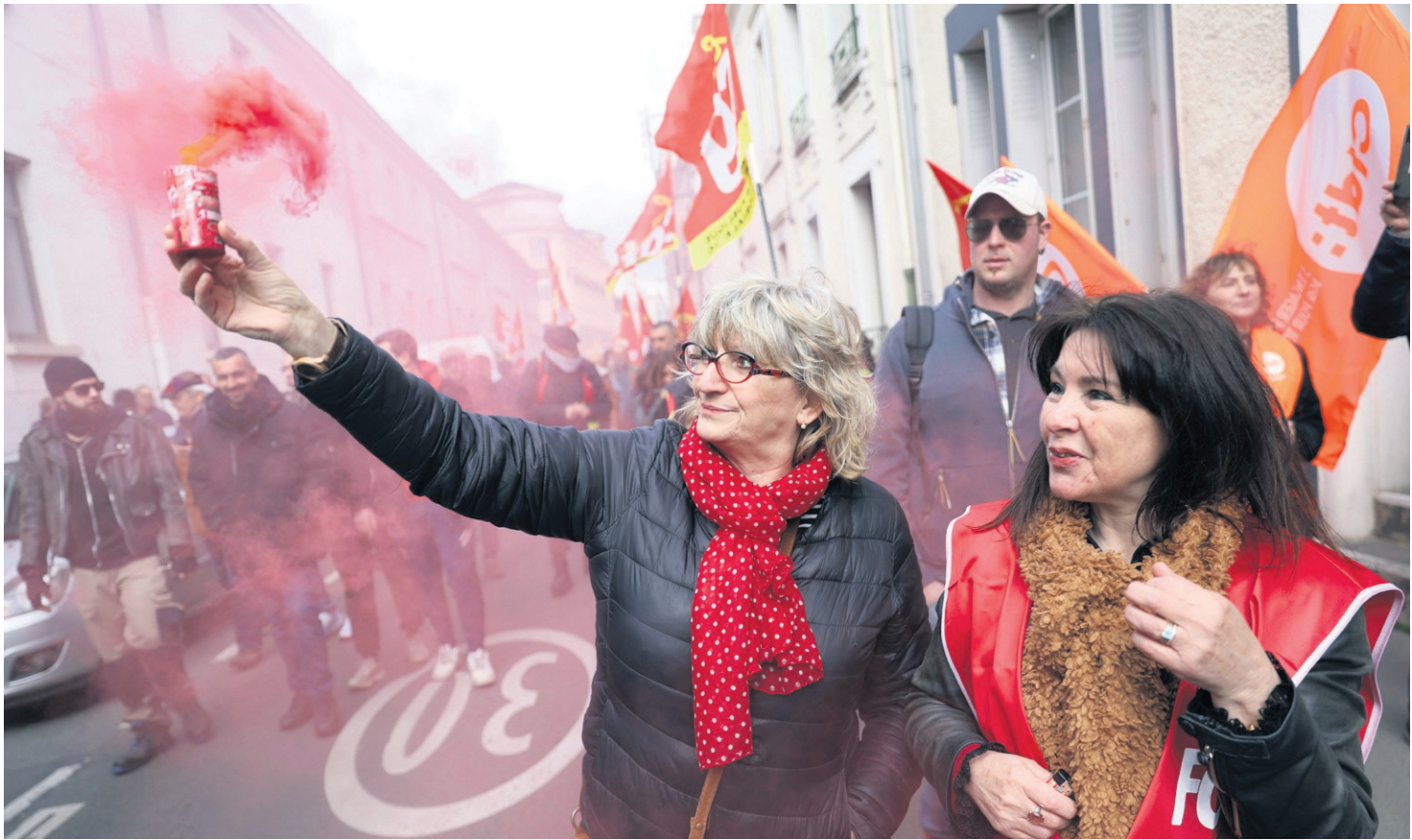
À la veille de la décision des Sages sur la réforme des retraites, moins de 3.000 personnes ont manifesté dans l'Indre.