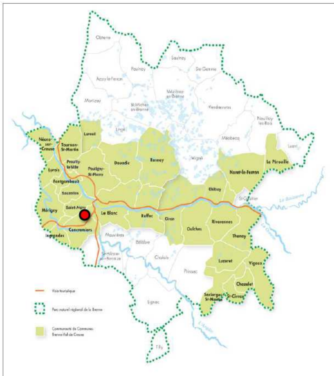
Localisation du projet

La société Picoty Centre a déposé 1 un dossier de demande d'autorisation environnementale pour un projet d'exploitation d'une installation de stockage temporaire avant expédition de déchets de type huiles usagées située sur le territoire de la commune de Le Blanc, dans le département de l'Indre.