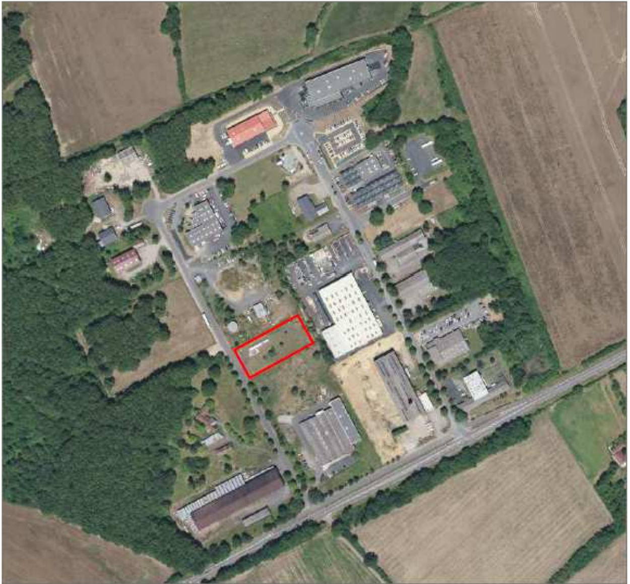
Vue satellite de la zone industrielle des Daubourgs

Actuellement, l'activité du site réside dans le négoce et le transport de carburants et produits combustibles : gazole non-routier (GNR), gazole (GO) et fioul domestique (FOD) auprès des particuliers et des entreprises. L'activité prévue après mise en œuvre du projet consiste à collecter, regrouper et expédier des déchets dangereux de type huiles usagées auprès des entreprises en lieu et place de l'activité existante. Ces déchets seront utilisés en valorisation énergétique.