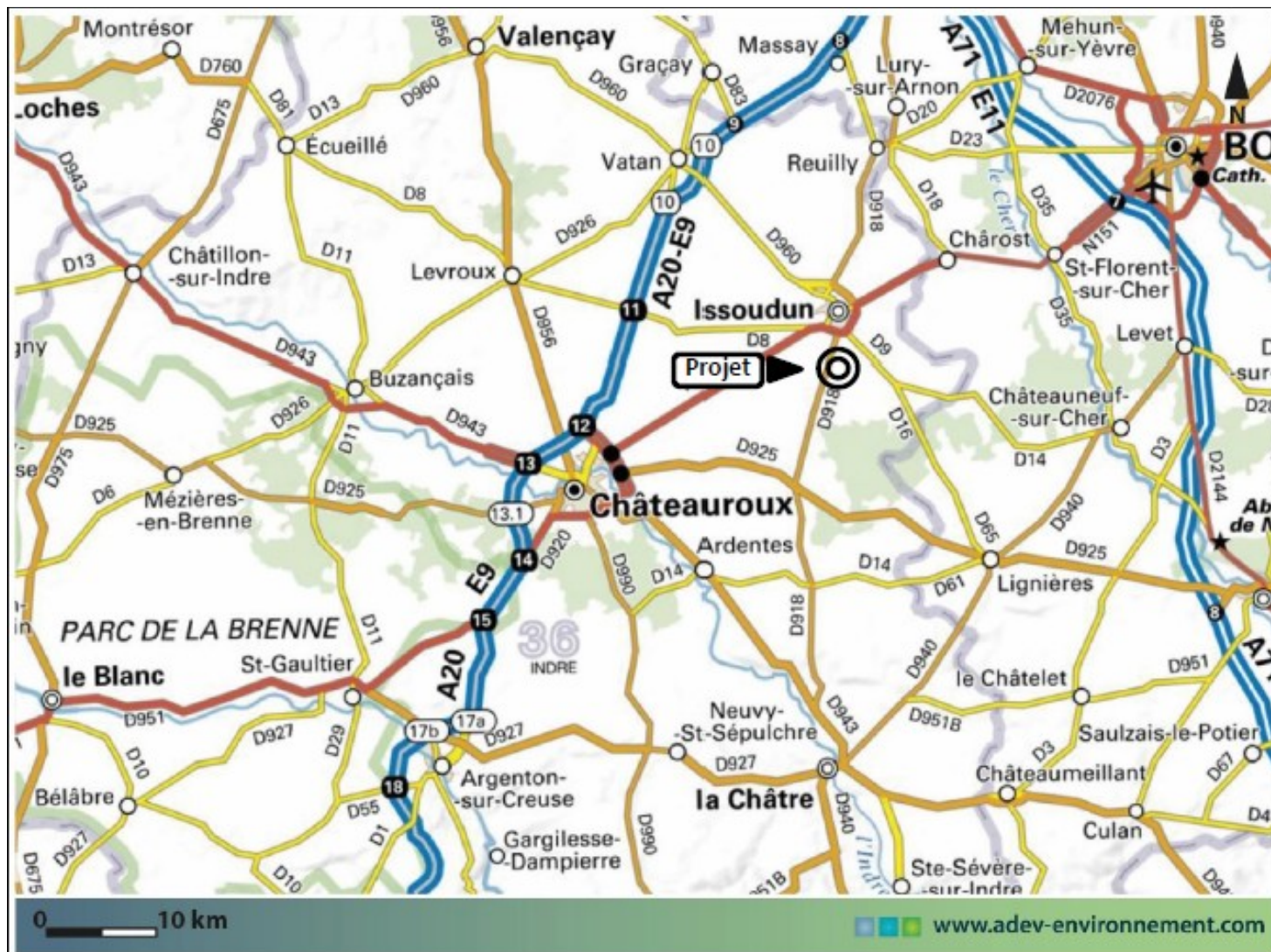
Illustration 1 : Localisation du projet, entre Bourges et Châteauroux

Le projet porté par la société Green LightHouse Développement (GLHD) consiste en l'installation d'un parc agrivoltaïque au lieu-dit « La Cible », sur la commune de Condé, dans l'est de l'Indre (36). La commune est située à une vingtaine de kilomètres au nord-est de Châteauroux, dans la région naturelle de la Champagne Berrichonne, et appartient à l'aire urbaine d'Issoudun.