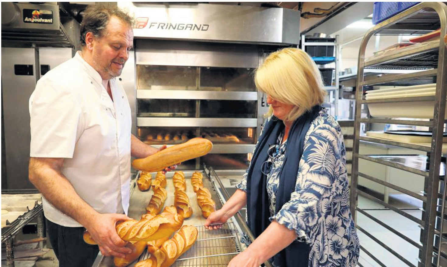
Des boulangers du Poinçonnet sont sous le choc. Ils ont reçu une facture de 18.487 € pour deux mois d'électricité.