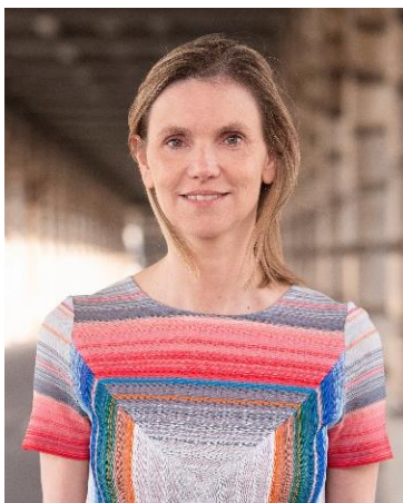
Agnès Pannier-Runacher, secrétaire d'État auprès du ministre de l'Économie et des Finances

SignalConso est un dispositif d'alerte de la Direction générale de la concurrence, de la consommation et de la répression des fraudes (DGCCRF) qui permet de signaler en quelques clics des difficultés dans le domaine de la consommation et d'obtenir des conseils pour agir.