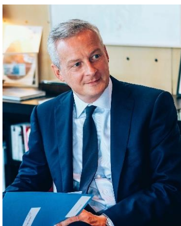
Bruno Le Maire, ministre de l'Économie et des Finances

La consommation est un acte du quotidien pour les Français. Les erreurs, les fraudes, les arnaques, les manquements aux règles de sécurité sont autant de situations qui peuvent avoir des conséquences lourdes sur le pouvoir d'achat ou la santé des consommateurs. Même mineures, les infractions à la réglementation sont toujours vécues comme irritantes.