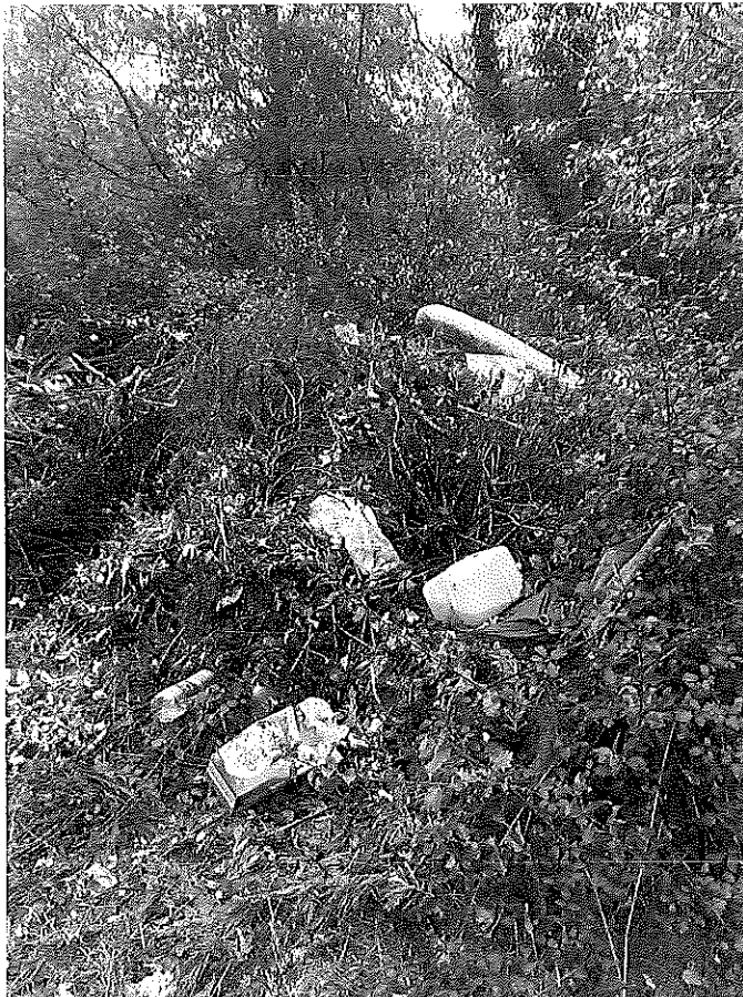
Déchets dans la ZNIEFF