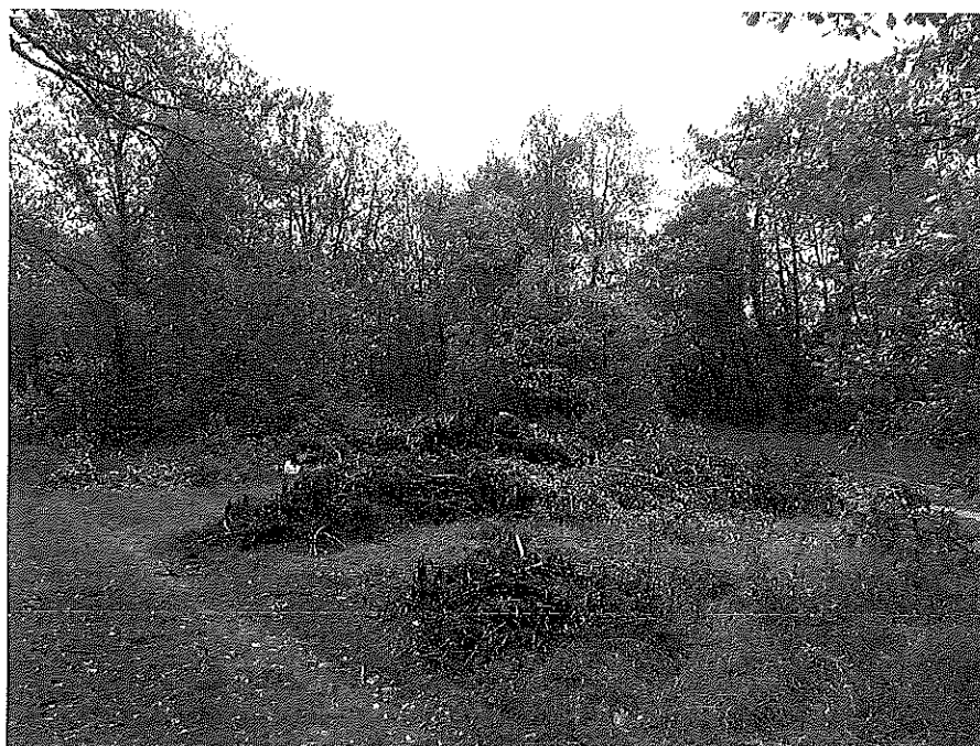
Des déchets végétaux, entre deux chemins, dans la ZNIEFF. Ces déchets ont-il leur place ici?