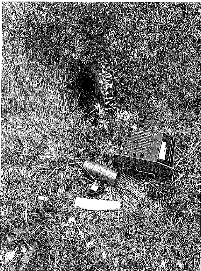
Déchets sur le bord du chemin, présents depuis 1 an au moins.

Quelques morceaux choisis de ce que l'on peut rencontrer en se baladant sur ce chemin communal. (prises de vues 14 novembre 2018)